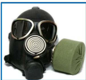
Противогаз гражданский ГП-7

Предназначен для защиты органов дыхания, кожи лица и глаз человека от отравляющих веществ, аварийно химических опасных веществ (кроме аммиака), радиоактивной пыли и биологических аэрозолей. Используется гражданским взрослым населением в целях выполнения мероприятий ГО.