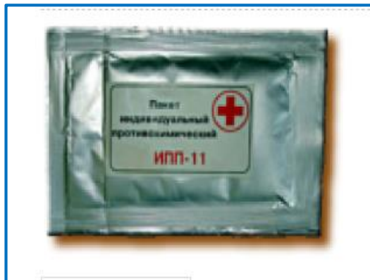
Индивидуальный противохимический пакет (ИПП-11)

Индивидуальный противохимический пакет (ИПП-11) предназначен для профилактики поражений кожных покровов капельно-жидкими отравляющими и химически опасными веществами через открытые участки кожи, а также для нейтрализации этих веществ на коже и одежде человека, СИЗОД и инструментах в интервале температур от -20^{\circ}\text{C} до +50^{\circ}\text{C} . При заблаговременном нанесении на кожу защитный эффект сохраняется в течение 24 часов.