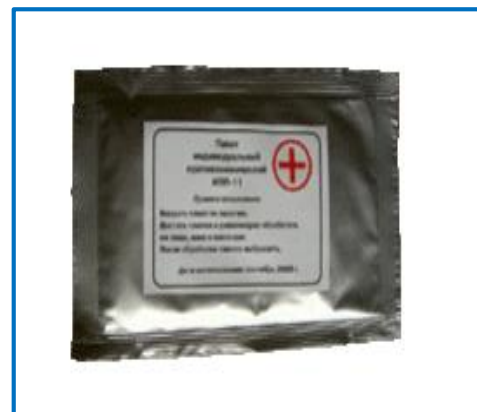
Индивидуальный противохимический пакет (ИПП-11)

Предназначен для обеспечения личного состава формирований ГО и населения при выполнении ими мероприятий по оказанию первой помощи пострадавшим, в районах возможных ЧС.