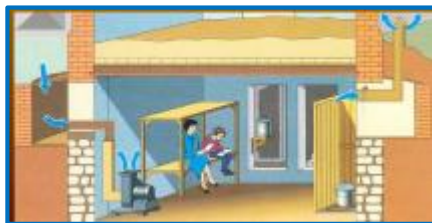
ПРУ в частном доме