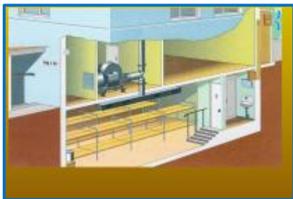
ПРУ в многоэтажном доме