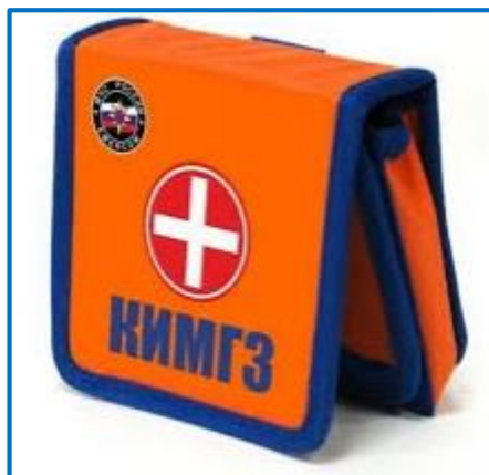
Комплект индивидуальный медицинский гражданской защиты (КИМГЗ)

Предназначен для обеспечения личного состава формирований ГО и населения при выполнении ими мероприятий по оказанию первой помощи пострадавшим, в районах возможных ЧС.