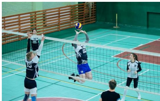
Спортивные состязания по волейболу, приуроченные ко Дню солидарности в борьбе с терроризмом

НИЯУ МИФИ сотрудничает с местными и международными организациями, нацеленными на предотвращение насилия и борьбу с терроризмом и преступностью es .