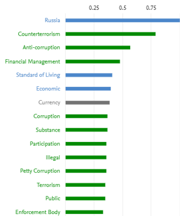
Актуальность ключевых фаз

699 Количество просмотров 67 Количество цитирований