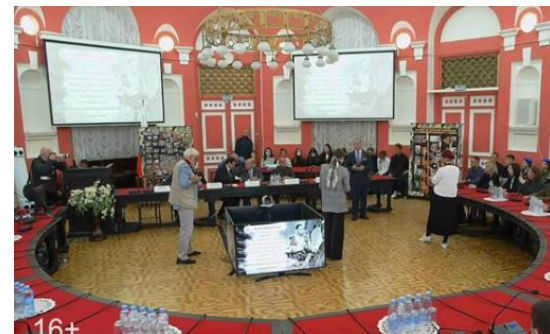
Прямая трансляция «Урока мужества»