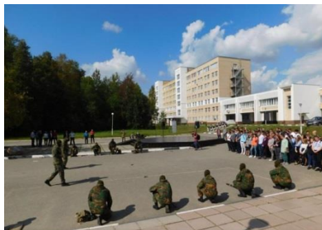
День борьбы с терроризмом в ИАТЭ НИЯУ МИФИ